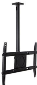
Exemple de support d'écran plafond