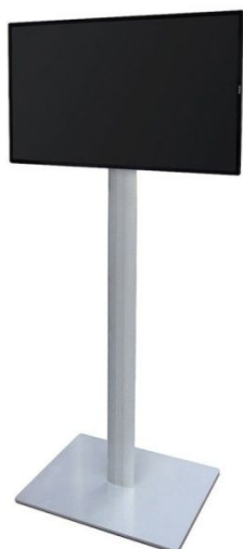
Exemple de support d'écran sur pied